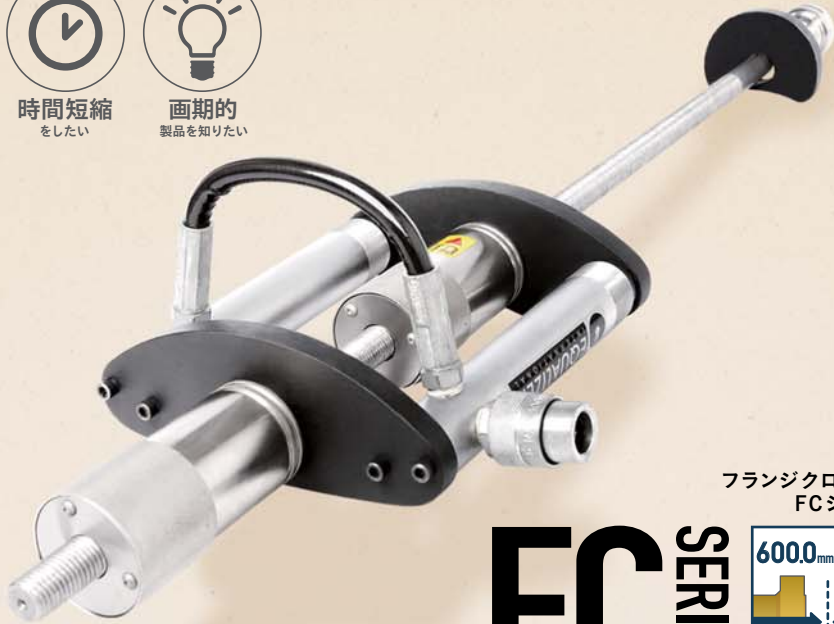
フランジクローザー FCシリーズ