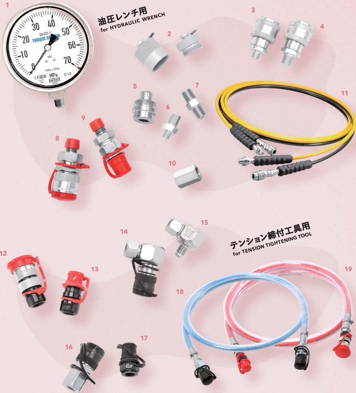
油圧レンチ用 for HYDRAULIC WRENCH