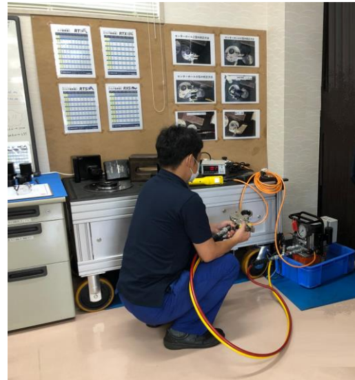
国家標準、国際標準にトレースされた標準器を使用し、温度管理された校正室で校正を行っております