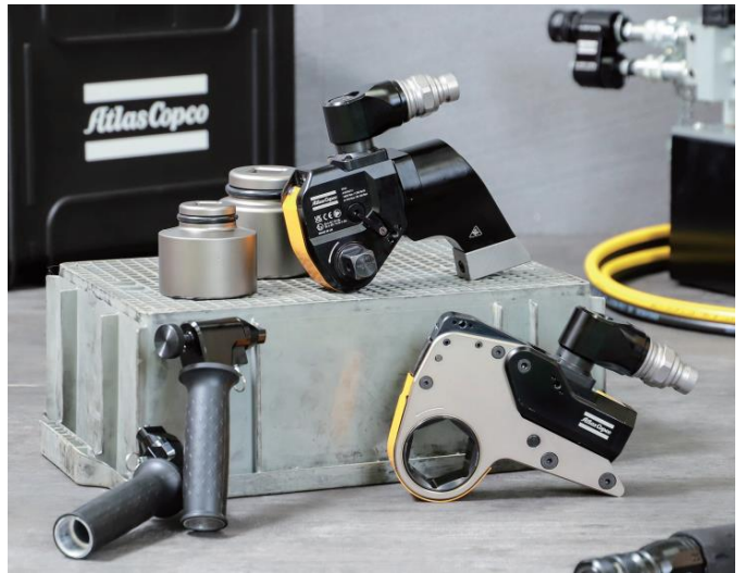
2023年 最新製品の 油圧トルクレンチ TF、TFX シリーズ — 安全性、作業性が大きく改善、トラブルリスクの少ない作業を実現 —

取り扱う製品は、油圧式トルクレンチ、バッテリー式トルクレンチ、エアトルクレンチ、油圧ポンプ、ボルトテンショナーのほか、フランジ関連ツール、高周波ボルトヒーター、超音波軸力計など種類も豊富に取り揃えています。